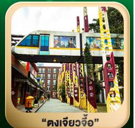
“ตงเจียวจื่อ”