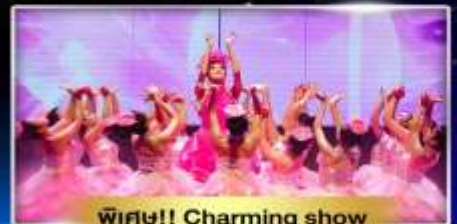
พิเศษ!! Charming show