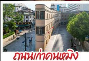
ถนนเก่าคุณหมิง