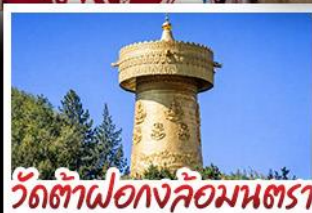
วัดต้าฝอ กงล้อมณฑล