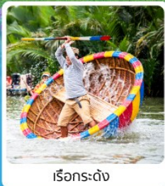
เรือกระดง