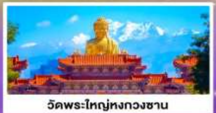
วัดพระใหญ่ทงกวงชาน