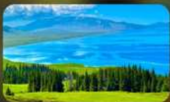
ทะเลสาบโซหลี่มู่