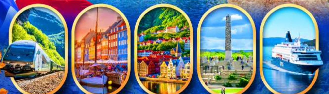
รถไฟฟลิมส์บาน่า ท่าเรือฮาวน์ พักเมืองเบอร์เก็น วิกเกอร์แลนด์ นั่งเรือ DFDS