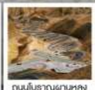
ถนนโบราณผานหลง