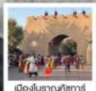
เมืองโบราณกัชการ์

ทัวร์คุณภาพ ไม่ลงร้านช้อปปิ้ง / ไม่ขายออฟชั่น