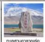
ทะเลสาบคาคาตุเค่อ

หมู่บ้านอิงจีซา-เมืองซาเซอ / สุสานอาหมั้นหนี่ซายัน / สุสานพระราชวงศ์ซาเซอ / อำเภอหน่ายโก๊ตตี้ / หมู่บ้านกาพวาดชาวตาวกลาง / สุสานพระนางเซียงเฟย / ทะเลสาบไปซาหุ ทะเลสาบคาคาตุเค่อ / ภูเขาหิน Muztagh Peak / ชายแดนทาจิกิสถาน (ด่านคาคาซุ) / อุโมงค์ดินหยางคิ้ว / ถนนโบราณผานหลง / ทะเลสาบบันตี้ร์ บลูลาคุน เมืองซินกัชคอร์กัน / ทุ่งหญ้าทองคำ / ที่ราบชุ่มน้ำท่าหม่าน / สวนหินแดง / ต้าซ่าฮอยสายรุ้ง / พิธีเปิดเมืองเก่า (รวมรถกอล์ฟ) / หมู่บ้านอุยกูร์ / มัสยิดอัลคาห์ โรงน้ำชาโรยปี / ถนนคนเดินHandmade / ถนนภาพเขียนสีน้ำมัน