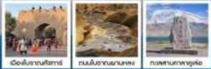
เมืองโบราณกัซการ์ ถนนโบราณพาหนหลง ทะเลสาบคาลาคู๋เส่อ

ซินเจียงใต้ • คัชการ์ • ทะเลสาบโปซาหู่ 8 DAYS 7 NIGHTS