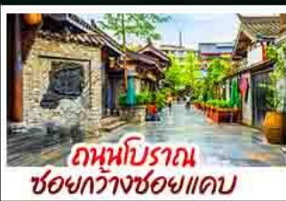
ถานนป๊อบราณ ช่อยกวางช่อยแคบ