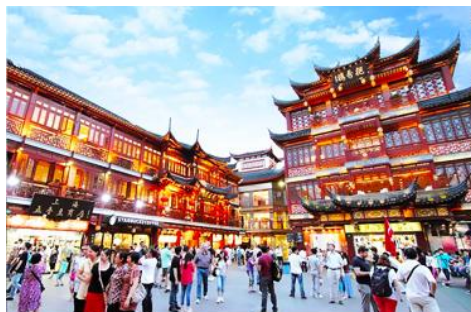
ตลาดเจิงหวงเมี่ยว

เช้า รับประทานอาหารเช้า ณ ห้องอาหารของโรงแรม (6)