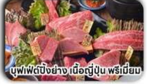
บุฟเฟ่ต์บิงย่าง เนื้อญี่ปุ่น พรีเมียม