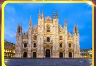
มหาวิหารแห่งเมืองมิลาน