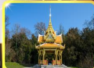
ศาลาไทยไลซานท์