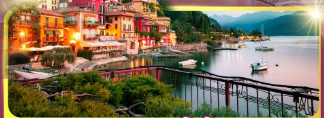
ทะเลสาบโลโบ