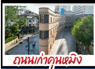
ถนนเก่าคูหนิง