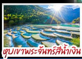
ตูปเขาพระจันทร์สีน้ำเงิน