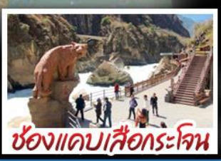
ช่องแคบเสือกะโจน