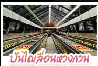
บันไดเลื่อนแขวงกาน