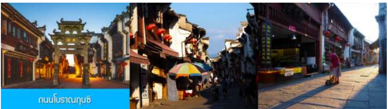
ถนนโบราณฉุนซี

อิสระอาหารมื้อกลางวัน ( ท่านสามารถเลือกชิมอาหารพื้นเมืองในระแวกโรงแรมได้ตามอัชฌาศัย )