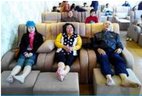
ศูนย์วิจัยแพทยแผนจีน