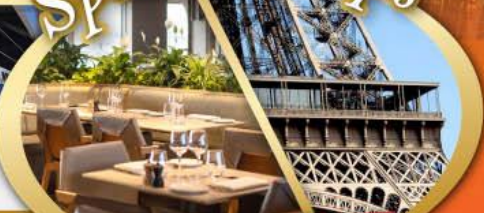
รับประทานอาหารกลางวันบนหอไอเฟล

ไฮไลท์ในโปรแกรม • สะพานไมซ์าเปล ลูเซิร์น