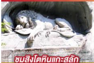
ชมสิงโตหินแกะสลัก