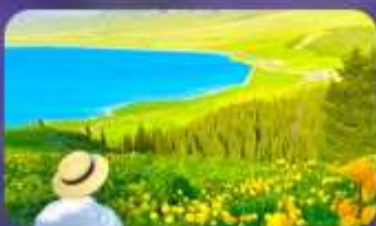
ทะเลสาบไซ่หลี่มู่