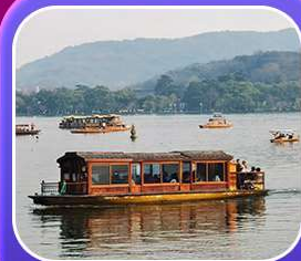
“ล่องเรือทะเลสาบซีหู”