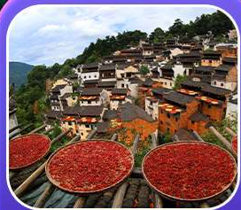
“หมู่บ้านหวงหลิง”

หุบเขาเทวดาวังเซียนกู่ หมู่บ้านที่ตั้งอยู่ริมหน้าผา • หมู่บ้านโบราณหวงหลิง ป่าสนน้ำชิงซาน • ล่องเรือทะเลสาบซีหู • ถนนโบราณตุ๋นโจ้ว • ชมแสงสีที่ ฉู่หนีโจ้ว