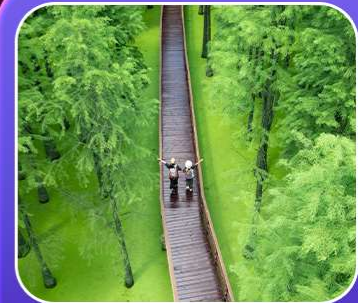
“ป่าสนชิงซาน”

T2G-HGH01GJ Welcome Hangzhou...หังโจว ฉู่โจว ฉู่หยวน ช่างเหรา หุบเขาเทวดา 5D 4N (GJ)