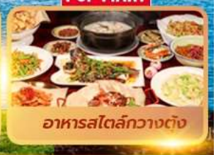
อาหารสไตล์กวางตุ้ง