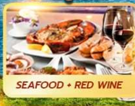
SEAFOOD + RED WINE