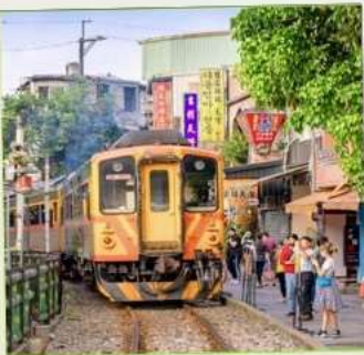
สถานีรถไฟสี่เฟิ่น