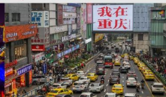
กวนอิมเจียว

*ทางบริษัทฯ ขอสงวนสิทธิ์ในการสลับโปรแกรมทัวร์ตามความเหมาะสมขึ้นอยู่กับสถานการณ์หน้างาน โดยคำนึงถึงผลประโยชน์ของลูกค้าเป็นสำคัญ