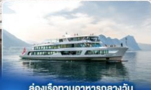
ล่องเรือทานอาหารกลางวัน ทะเลสาบลูเซิร์น