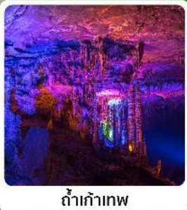
ดำเก้าทพ