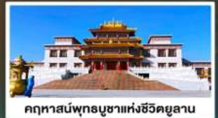
คฤหาสน์พุทธบูชาแห่งชีวิคยูลาน