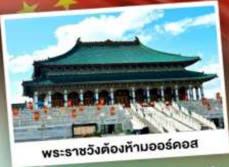
พระราชวังต้องห้ามออร์ดอส

ตะลุยเป็นทราเยอร์เพลง แห่งมองโกเลียใน ชมวิวทุ่งหญ้าโล่งกว้างตัดขอบฟ้าคราม