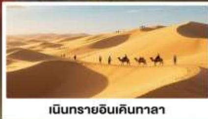
เนินทรายอินเคินทาลา