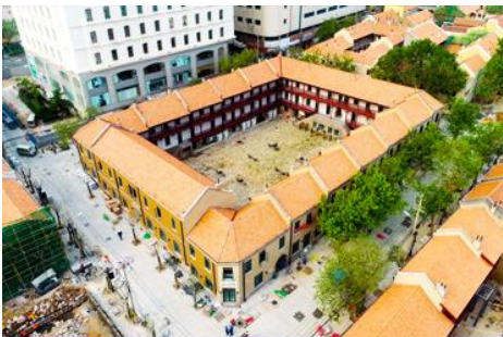
เมืองเก่าเยอรมัน ตรอกกว่างซิงหลี่