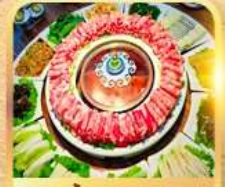
สุกีสไตล์มองโก