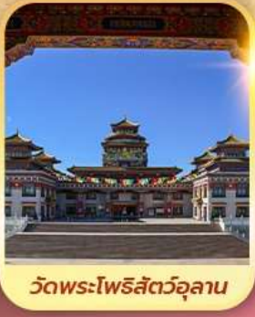
วัดพระโพธิสัตว์อูลาน