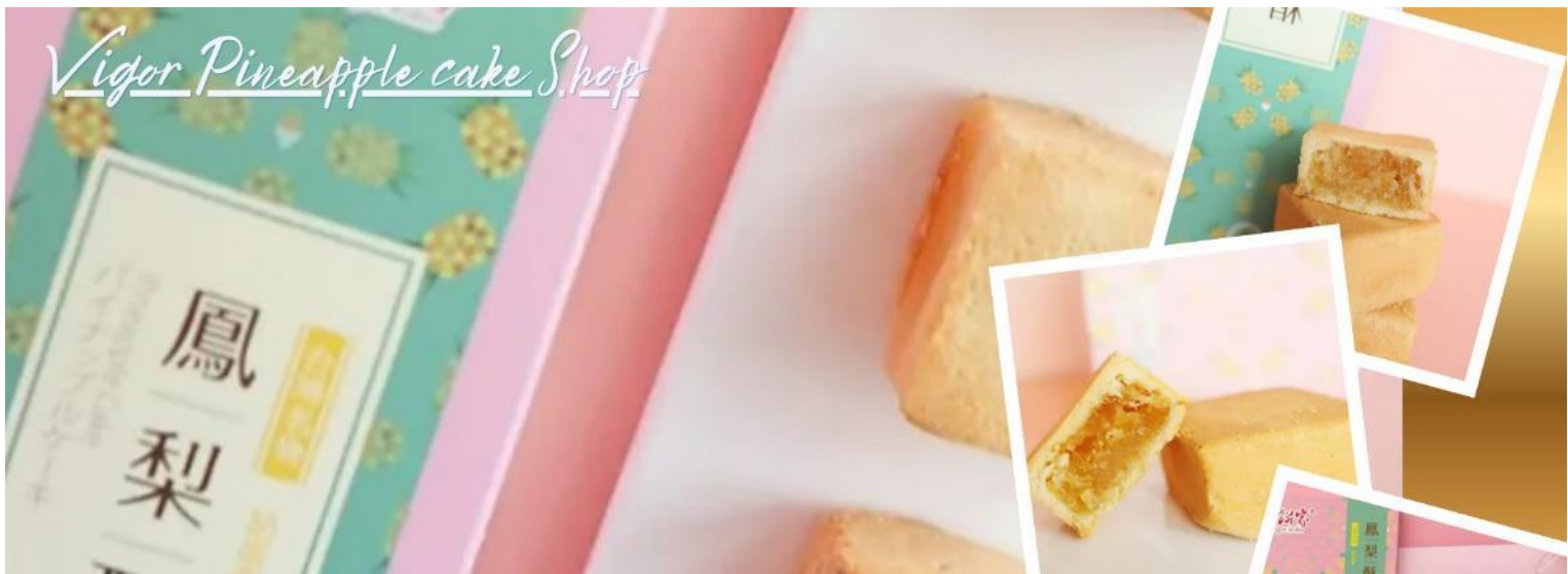
Vigor Pineapple cake Shop

จากนั้นแวะซื้อป๊องร้านพายสับประรด (Vigor Kobo) สินค้าขึ้นชื่อของไต้หวันที่ได้รับความนิยมระดับสากล อิสระเลือกซื้อเป็นของฝากอามอัธยาศัย