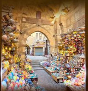
ตลาดงานเวลาสี่