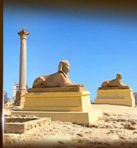
เฮลิโพลิส