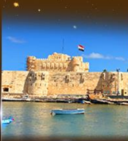
บึงปรามาร Quite Bay