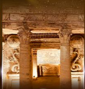
สุสานใต้ดินอเล็กซานเดรีย