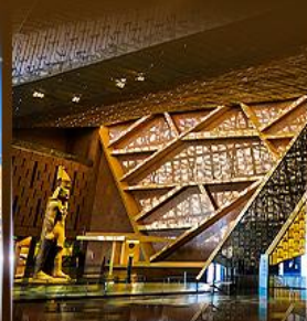
พิพิธภัณฑ์ไทรนิตี้อียิปต์ (GEM)