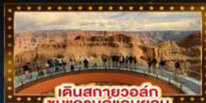
เดินสกายวอล์ก ชมแกรนด์แคนยอน