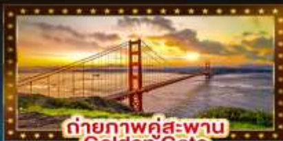
ถ่ายภาพคู่สะพาน Golden Gate