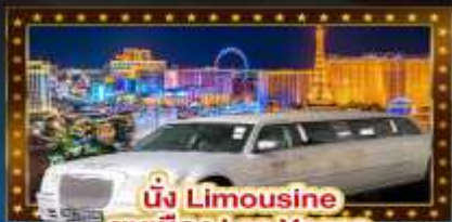
นั่ง Limousine ชมเมือง Las Vegas