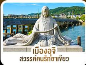
เมืองอจิจิ สวรรค์คนรักชาเขียว