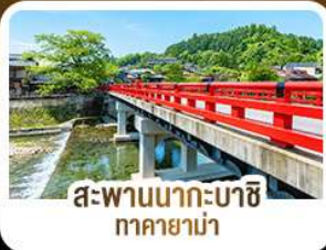
สะพานนากะบาชิ ทาคายาม่า