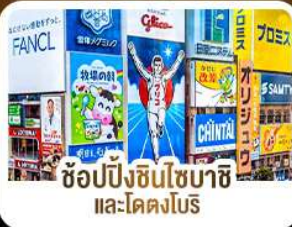
ช้อปปิ้งชินโซบาชิ และโดตงโมริ