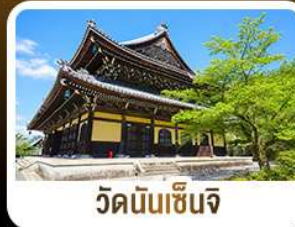
วัดนันเซ็นจิ