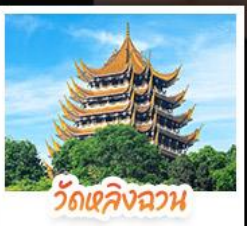
วัดเลิ่งฉวน