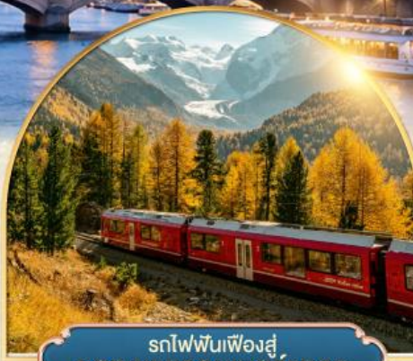
รถไฟฟันเฟืองสู่ ยอดเขากรอนเนอร์เกรต