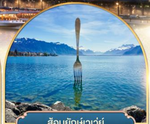
ส้อมยักเขาวัว