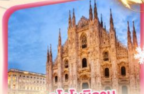
คูโอโมมิลาน