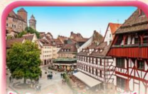
สัมผัสเมืองเก่าบูเรมเบิร์ก