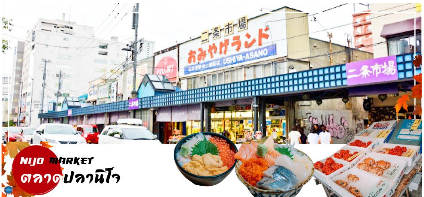
NIJO MARKET ตลาดปลาชิโง

จากนั้นนำท่านเดินทางสู่ เมืองซัปโปโร (SAPPORO) (ใช้เวลาเดินทางประมาณ 1 ชั่วโมง) เพื่อนำท่านสู่ ตลาดปลาชิโง (Nijo Market) ตลาดปลาใจกลางเมืองซัปโปโร แม้มิขนาดใหญ่แต่ด้วยที่อยู่กลางเมือง เดินทางสะดวกและสินค้าครบครัน เป็นที่นิยมของนักท่องเที่ยวญี่ปุ่นและต่างชาติจำนวนมาก ตลาดปลาแห่งนี้ประกอบด้วยร้านจำหน่ายอาหารทะเลสดๆ ร้านจำหน่ายสินค้าแปรรูป ต่างๆ ห้ามพลาด!!! สำหรับผู้ที่ชื่นชอบรสชาติของปูชนยักษ์ อันเลื่องชื่อแห่งเกาะฮอกไกโด ที่ตลาดแห่งนี้ท่านจะเห็นปูชนตัวเป็นๆ วางน้ำในตู้ ที่ต้องบอกว่าราคาไม่แพง หรือ จะเป็น หอยเชลยช่าง ที่ทานกับโชยุ นอกจากนี้ ยังมีร้านอาหารที่อยู่ด้านหลังผ้ามานใสๆ กันจก หากท่านอยากทานอาหารปรุงสุก สดใหม่ก็สามารถออเดอร์ด้านหน้าและเข้าไปรอนั่งรับประทานด้านหลังได้เลย ก่อนจะอ้อมกันยังมีเมล่อนสีส้มหวานฉ่ำ ที่มาทานปิดท้ายอีกด้วย