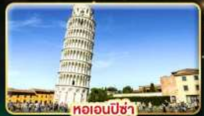
หออนพีซ่า