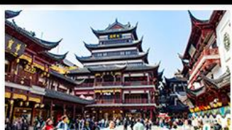
ตลาดร้อยปีเฉิงหวงเมี่ย