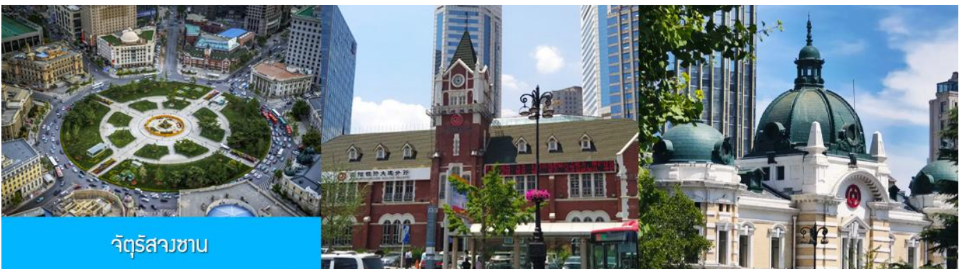
จัตุรัสวงเวียน

จากนั้นนำท่านเที่ยวชม อ่าวหลิงเจี้ยว 菱角湾 เป็นอ่าวธรรมชาติและแลนด์มาร์กถ่ายรูปสุดฮิตในเมืองต้าเหลียน ประเทศจีน โดดเด่นด้วยทิวทัศน์บ้านเรือนสีแสนสดใสเรียงรายริมน้ำ จนได้รับฉายาว่า "Little Santorini แห่งต้าเหลียน" และเป็นจุดชมพระอาทิตย์ตกที่สวยงามมากแห่ง