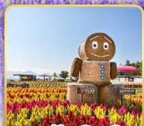
สวนซึกิไซโนะโอกะ