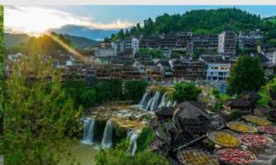
หมู่บ้านโบราณฝูหรงเจิ้น

*ทางบริษัทฯ ขอสงวนสิทธิ์ในการสลับโปรแกรมทัวร์ตามความเหมาะสมขึ้นอยู่กับสถานการณ์หน้างาน โดยคำนึงถึงผลประโยชน์ของลูกค้าเป็นสำคัญ