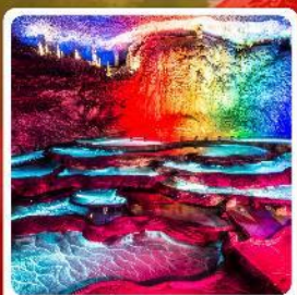
ถ้ำเก้าเทพ

ไฮไลท์! หมู่บ้านชาวน้ำเสียวเหอเจีย หมู่บ้านโบราณฟูรงเจิ้น ถ้ำเก้าเทพ ล่องเรือทะเลสาบผิงหู สวนถ้ำสามสหาย