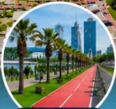
เดินเล่นริมทะเล บรรยากาศสุดชิล