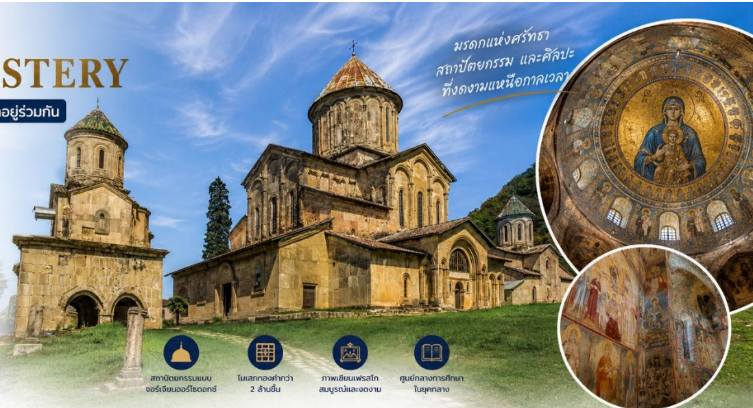
มรดกแห่งศรัทธา สถาปัตยกรรม และศิลปะที่งดงามเหนืออวกาศเวลา