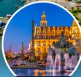
น้ำพุ The Neptun แห่งบาตุมิ