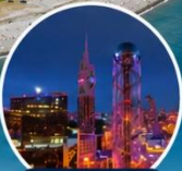
ชมแสงสียามค่ำคืนของเมืองบาตุมิ