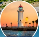
ประภาคารบาตุมิ สัญลักษณ์ของเมือง