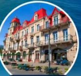
ย่านเมืองเก่า บรรยากาศยุโรป