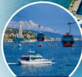
กระเช้าอาร์โก ชมวิวเมืองบาตุมิ

การล่องเรือขึ้นเข้านั่งอยู่กับสภาพอากาศ กรณีที่ไม่สามารถล่องเรือได้ ทางบริษัทของสงวนสิทธิ์ปรับเปลี่ยนโปรแกรมตามความเหมาะสม