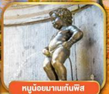
ทูน้อยมานเทินพิส