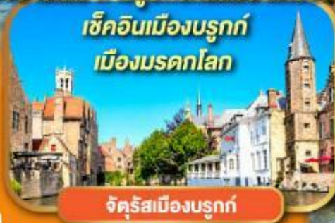
จัตุรัสเมืองบรูกซ์