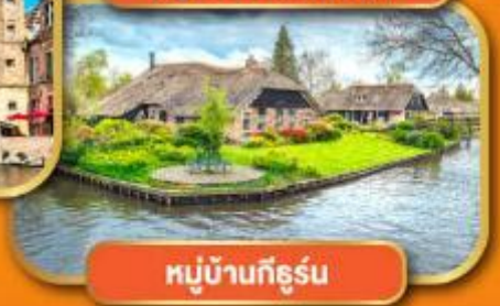
หมู่บ้านก็ธูร์น