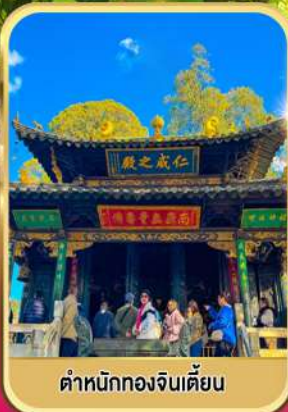
ตำหนักทองจีนเตียน