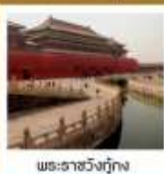
พระราชวังปักกิ่ง