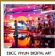
EDCC YIYUN DIGITAL ART