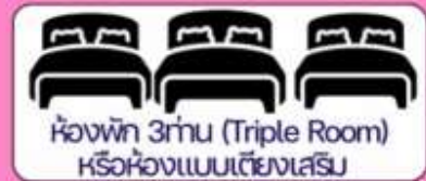
ห้องพัก 3 ท่าน (Triple Room) หรือห้องแบบเตียงเสริม

กรณีพัก 3 ท่านถ้าวันที่เข้าพักโรงแรม ไม่มีห้อง TRP (3 ท่าน) อาจจำเป็นต้องแยกพัก 2 ห้อง (มีค่าใช้จ่ายพักเตียงเพิ่ม)