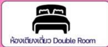
ห้องเตียงเดี่ยว Double Room