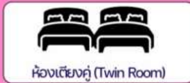
ห้องเตียงคู่ (Twin Room)