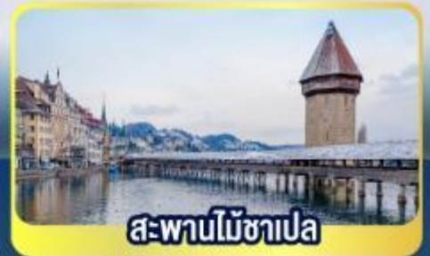
สะพานไม้ซาเปล