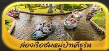
คลองเรือชมหมู่บ้านกังหัน