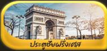
ประตูชัยฝรั่งเศส

พิเศษ!! ล่องเรือแม่น้ำแซนชมเมือง โดย บาโด มุช