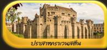
ปราสาทราเวนสตัน