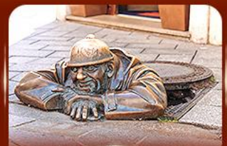
แลนด์มาร์คคิง รูปปั้นคูมิล ปรากติสลาวา