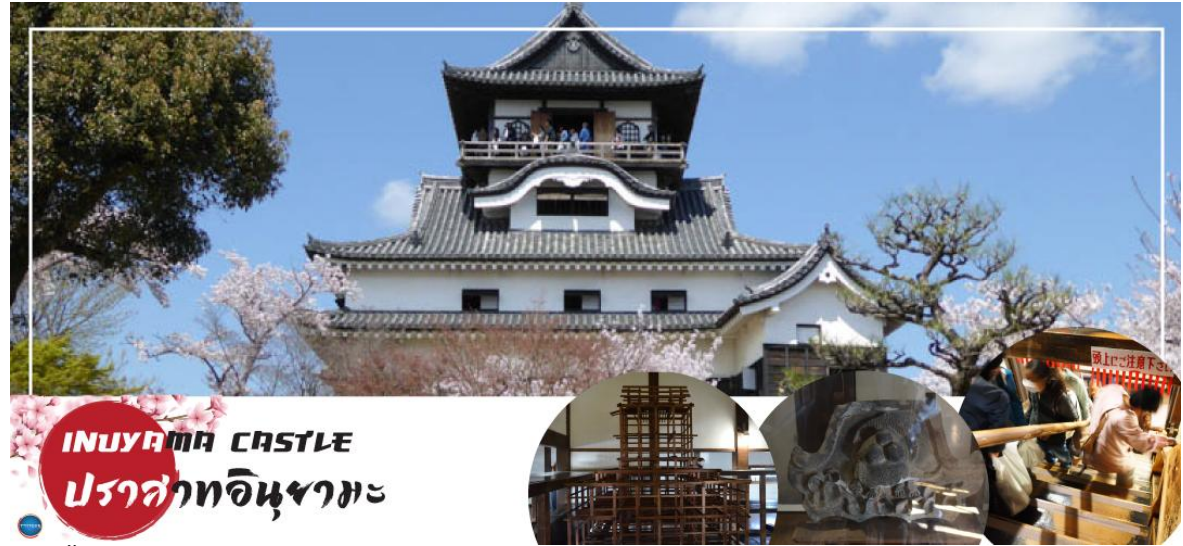
INUYAMA CASTLE ปราสาทอินยามะ

นำท่าน เข้าชม ปราสาทอินยามะ (Inuyama Castle) ตั้งอยู่ใจกลางเมืองอินยามะ ทางตะวันตกเฉียงเหนือของจังหวัดไอจิ ประเทศญี่ปุ่น เป็นปราสาทที่สร้างขึ้นในตอนปลายศตวรรษที่ 16 ที่อยู่รอดมาจนถึงปัจจุบัน ปราสาทแห่งนี้มีความพิเศษตรงที่มีหอคอยที่มีความเก่าแก่ที่สุดในประเทศ ดังนั้นปราสาทแห่งนี้จึงได้รับการประกาศให้เป็นสมบัติของชาติ ด้านในของปราสาทมีการจัดแสดงอาวุธในการทำสงครามในสมัยต่าง ๆ ของญี่ปุ่น และเราสามารถเดินขึ้นไปด้านบนเพื่อชมความงามของตัวเมืองอินยามะ ตลอดจนแม่น้ำคิโซะ และที่ราบโนบิได้