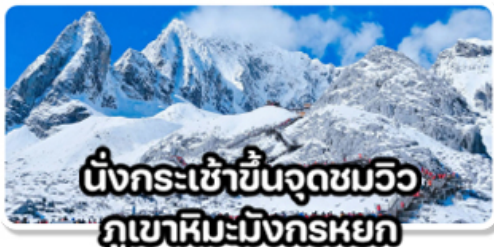
นั่งกระเช้าขึ้นจุดชมวิวกุเขาหิมะมังกรหยก