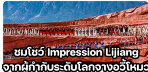
ชมโชว์ Impression Lijiang จากผู้กำกับระดับโลกจากอวีโใหม่