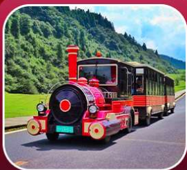
"อุทยานเขานางฟ้า"