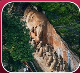
"ผาหินแกะสลักต้าจู้"