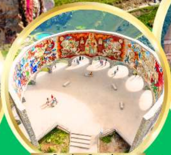
Russian-Georgian Friendship Monument